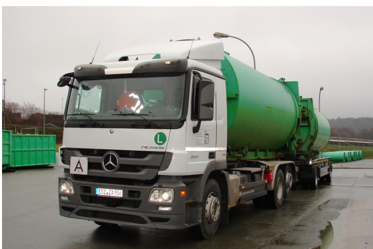
Bild 2: Transportfahrzeug des ZAS auf der Entsorgungsanlage in Niederdorf

31.833 t thermische Restabfallbehandlung SUEZ Energie und Verwertung GmbH Bayerische Straße 20, 06686 Lützen/OT Zorbau